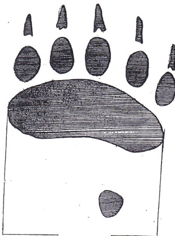
Karhun etutassun keskianturan leveys