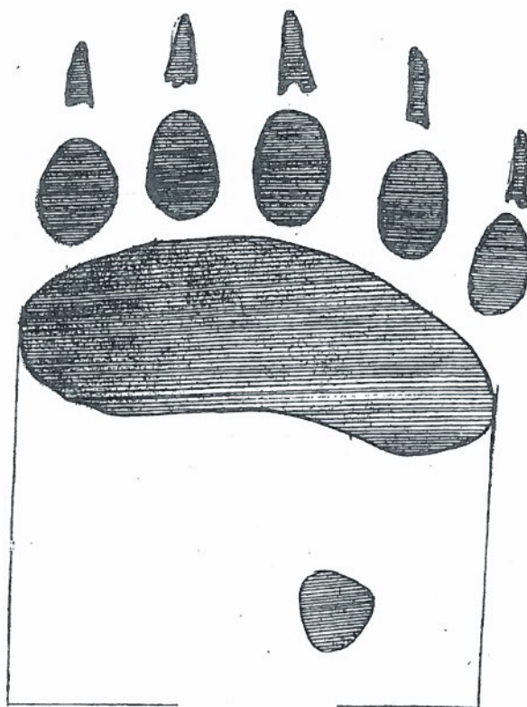
Karhun etutassun keskianturan leveys